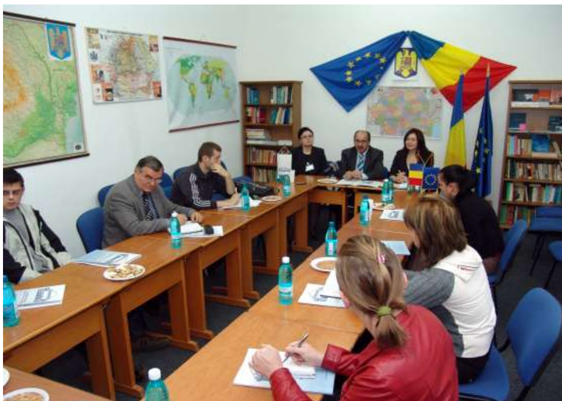
Conferința internațională a debutat cu o conferință de presă

În programul conferinței au fost susținute comunicări științifice pornindu-se de la reglementările naționale și europene în domeniul afacerilor până la metodologia investigării infracțiunilor și prezentarea mijloacelor tehnico-științifice necesare în activitatea de cercetare criminalistică a acestui tip de infraționalitate.